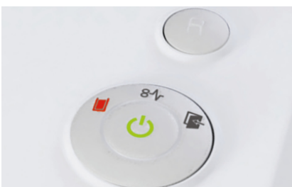
Der volle Auffangbehälter wird