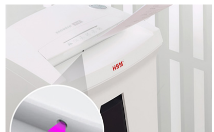
Eine integrierte Lichtschranke