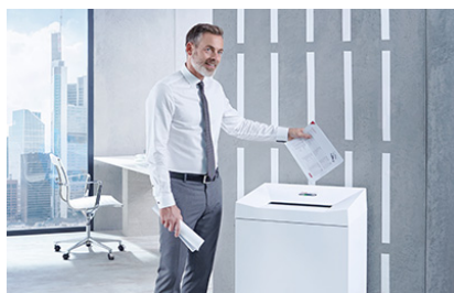
Bediening is zeer eenvoudig: bij