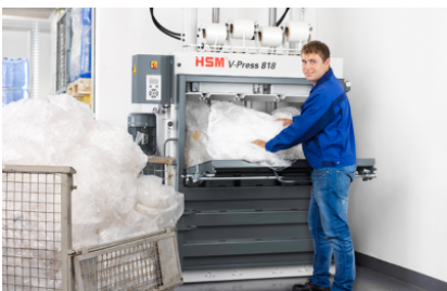
Geringe opstelhoogte en gering opstelvlak