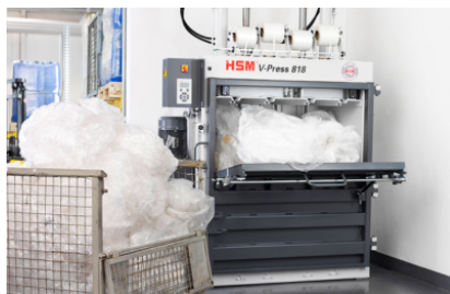
Voor het vullen van de pers scharniert de bovenste helft van de deur naar rechts