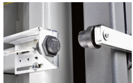
Automatische start van het persproces na het sluiten van de deur