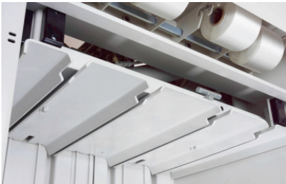
Massieve persplaat en uiterst stabiele persplaatgeleiding