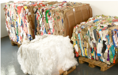
Zowel geschikt voor karton als folie