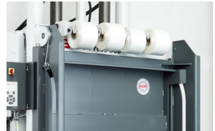
Omwikkeling van de baal met draad - optioneel met bandstation voor keuze van afbinden met polyesterband of draad beschikbaar