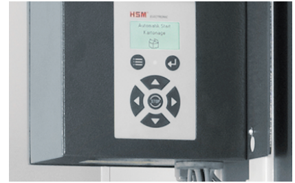
Comfortabele bediening door folietoetsenbord met tekstdisplay dat de desbetreffende actuele toestand van de machine weergeeft