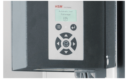
Comfortabele bediening door folietoetsenbord met tekstdisplay dat de desbetreffende actuele toestand van de machine weergeeft