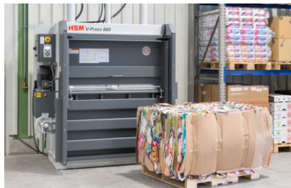
Produceert bijzonder grote, sterk gecompresseerde balen, die zonder ompersen op de marktgebracht kunnen worden