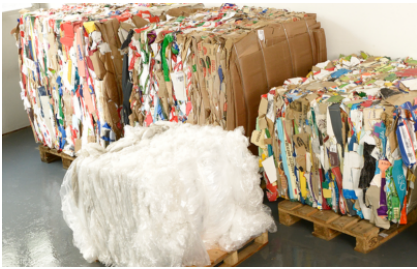
Zowel geschikt voor karton als folie