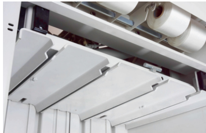
Massieve persplaat en uiterst stabiele persplaatgeleiding