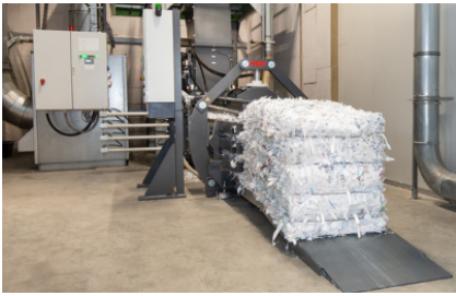
Integratie in geautomatiseerde, industriële productieprocessen