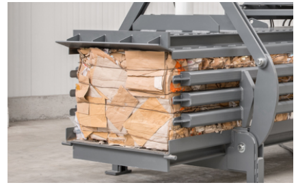
Geschikt voor het persen van papier, karton, geshredderd materiaal en folie