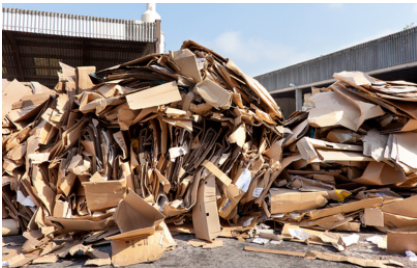
Veelzijdige oplossing voor materiaal tot ca. 60 kg / m 3 soortelijk gewicht