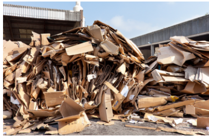
Veelzijdige oplossing voor materiaal tot ca. 60 kg / m 3 soortelijk gewicht