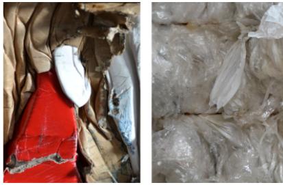
Bijzonder geschikt voor het persen van papier, karton en folie