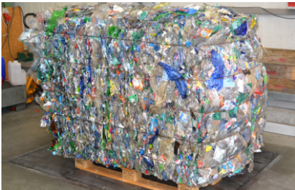
Bijzonder geschikt voor het persen van PET