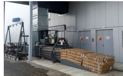
Voor nog veel meer toepassingsmogelijkheden ingezet worden. Neem contact met ons op als u andere materialen of toepassingen heeft. Wij vinden de passende oplossing.