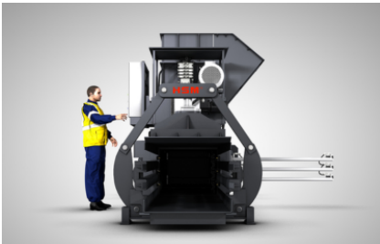
Bedieningszijde naar keuze