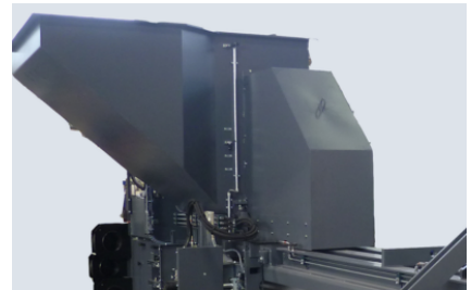
Met grote vulopening voor optimale toevoer (1140 mm lengte)