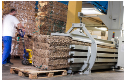
Voor continue toevoer met transportband, luchttoevoer e.d. geschikt