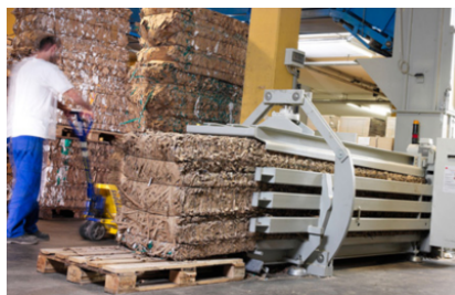
Voor continue toevoer met transportband, luchttoevoer e.d. geschikt