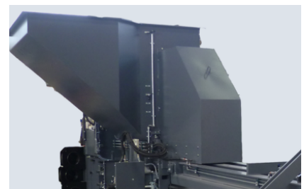
Met grote vulopening voor optimale toevoer (1140 mm lengte)