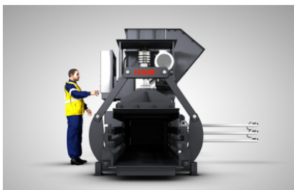
Bedieningszijde naar keuze