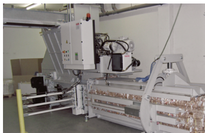
Integratie in geautomatiseerde, industriële productieprocessen