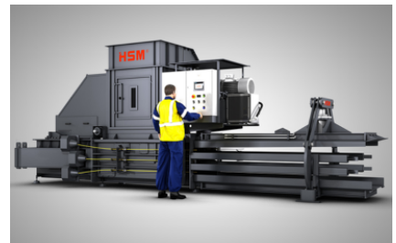
Zeer gering ruimtebeslag door bijzonder compact ontwerp