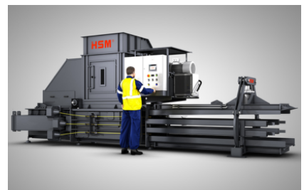
Zeer gering ruimtebeslag door bijzonder compact ontwerp