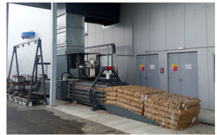
Voor nog veel meer toepassingsmogelijkheden ingezet worden. Neem contact met ons op als u andere materialen of toepassingen heeft. Wij vinden de passende oplossing.