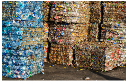
Hoge compressie en baalgewichten