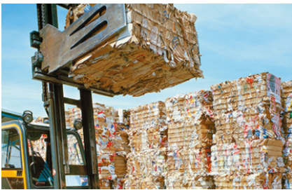
Bijzonder geschikt voor het persen van papier, karton en folie