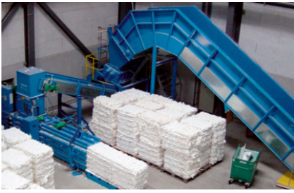
Integratie in geautomatiseerde, industriële productieprocessen