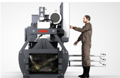
Bedieningszijde naar keuze