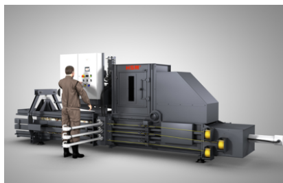
Vulopening van 1000 mm ook voor iets grotere materiaalstukken en iets hogere capaciteit geschikt