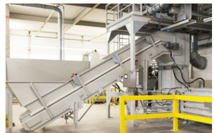
Voor continue toevoer met transportband, luchttoevoer e.d. geschikt