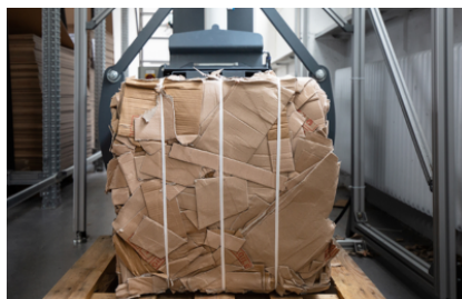
Optioneel als variant met manuele afbinding leverbaar