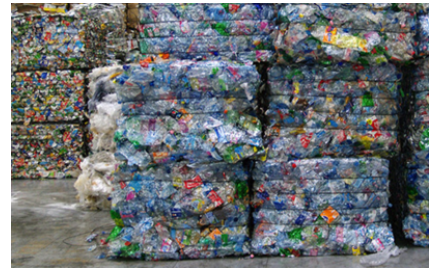
Bijzonder geschikt voor karton, folie en PET-flessen