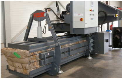
Zeer gering ruimtebeslag door bijzonder compact ontwerp