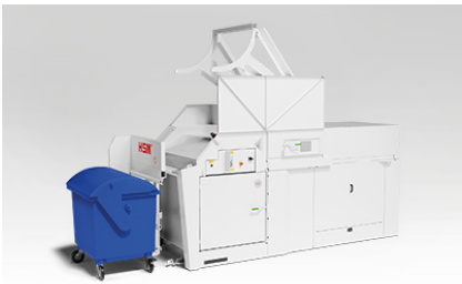
Legen van grote afvalcontainers (1 x 1100 ltr. of 2 x 240 ltr.)