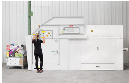
Heel geringe plaatsbehoefte