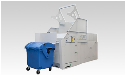
Legen van grote afvalcontainers (1 x 1100 ltr. of 2 x 240 ltr.)