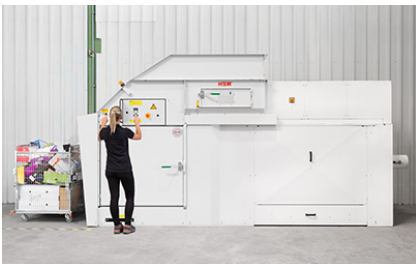
Heel geringe plaatsbehoefte