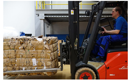
Geoptimaliseerde baalafmetingen en baalgewichten voor economisch laden van vrachtwagens