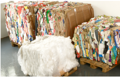
Zowel geschikt voor karton als folie