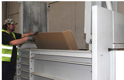
Groot gedimensioneerde invoeropening voor volumineus materiaal