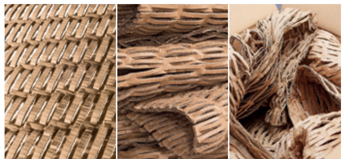
Das Verpackungspolster ist beliebig einsetzbar und schützt Gegenstände optimal – als Polstermatte, als Polsterwickel oder zum Füllen von Hohlräumen.