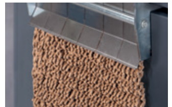
Herstellung von verdichtetem Füllmaterial mit geschlossener Stauchungsklappe (HSM ProfiPack P425).