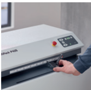
Die Maßskala ermöglicht ein einfaches Einstellen der gewünschten Materialbreite.