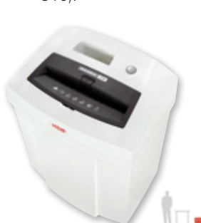
5 HSM SECURIO C14