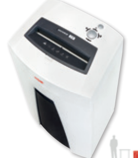
7 HSM SECURIO C18