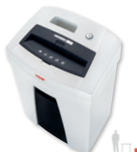
6 HSM SECURIO C16