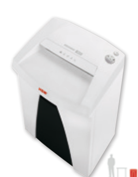
8 9 HSM SECURIO B22 / B24