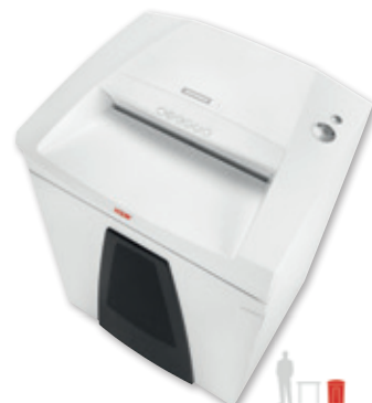
13 HSM SECURIO B35