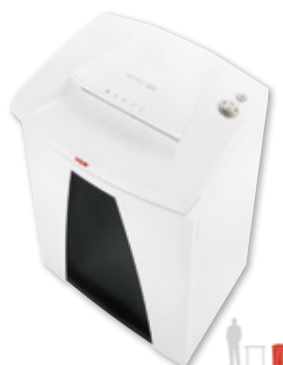
12 HSM SECURIO B34