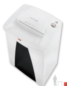
10 11 HSM SECURIO B26 / B32