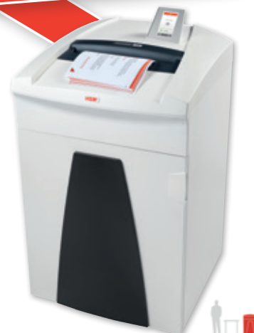
14 15 16 HSM SECURIO P36i/P40i/P44i