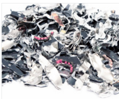
Rozdrobnione dyski twarde Rozmiar ścinka: 20 x 40-50 (<1000 m 2 ). Stopień bezpieczeństwa: H-4