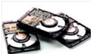
Niszczenie dysków twardych

Bezpiecznie i wydajnie, zgodnie ze sztuką ochrony danych.