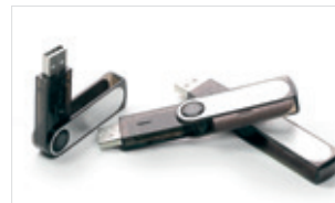
Niszczenie pamięci USB (HDS 230)