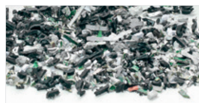
Rozdrobnione pamięci USB. Rozmiar ścinka: 11,5x26 mm (299 mm 2 )

Wszystkie dane techniczne i miary podano w przybliżeniu. Zastrzega się możliwość wprowadzania zmian.