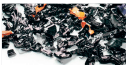
Rozdrobnione taśmy magnetyczne, karty plastikowe. Rozmiar ścinka: 11,5x26 mm (299 mm 2 ).