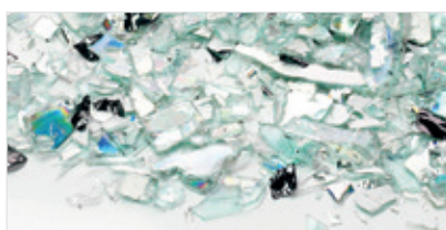
Rozdrobnione płyty CD, DVD i Blu-ray. Rozmiar ścinka: 11,5x26 mm (299 mm 2 ).