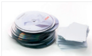
Niszczenie płyt CD, DVD i Blu-ray, kart plastikowych