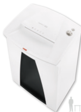
12 HSM SECURIO B34