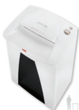
10 11 HSM SECURIO B26 / B32