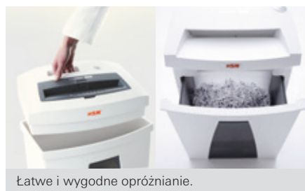
Łatwe i wygodne opróżnianie.