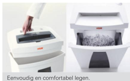
Eenvoudig en comfortabel legen.