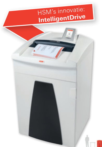
14 15 16 HSM SECURIO P36i/P40i/P44i

Performance voor een maximale snijden doorvoercapaciteit.