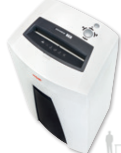
7 HSM SECURIO C18