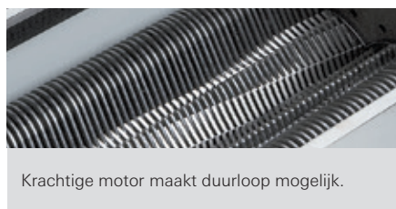
Krachtige motor maakt duurloop mogelijk.