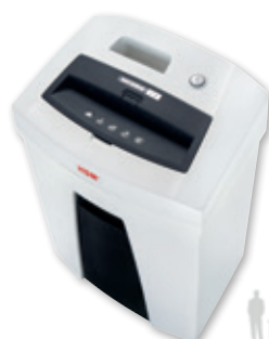
6 HSM SECURIO C16