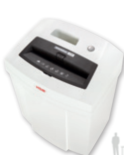
5 HSM SECURIO C14