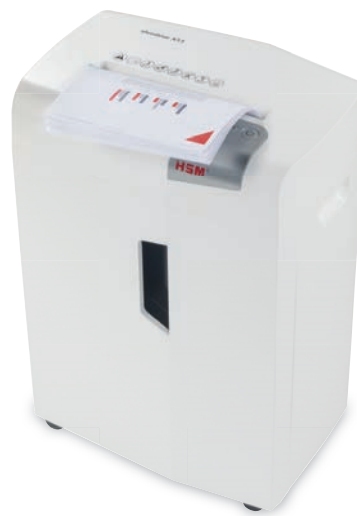
Der Aktenvernichter HSM shredstar X13 wurde entwickelt, um vertrauliche Dokumente einfach und sicher zu vernichten.

Deshalb führte Desree Watson ein Einverständnisformular ein, in das die Kunden bei jedem Besuch des Salons ihre Kontaktdaten eintragen mussten. Es war offensichtlich, dass die Einführung dieser Formulare die Aufbewahrung einer großen Menge an sensiblen Daten mit sich bringt. Gemäß der DSGVO ist die Inhaberin selbst für die ordnungsgemäße Nutzung, Speicherung und rechtzeitige Vernichtung verantwortlich. Deshalb führte sie einen Prozess ein, bei dem die Formulare mit den personenbezogenen Daten nach Datum sortiert und in einem verschlossenen Schrank im Büro des Salons sicher aufbewahrt wurden.