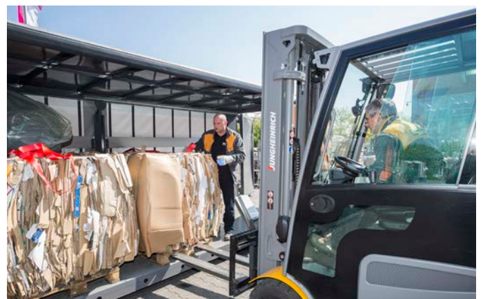
Załadunek samochodu „Wertstoffliner” firmy Hornbach

Dużą zaletą pras belujących marki HSM jest ich mobilność. – Gdy przyjmowanie towarów jest reorganizowane, można łatwo przestawić maszyny HSM na nowe miejsce – mówi Back. Po wielu latach współpracy rysuje się „absolutnie pozytywny bilans” dla jakości serwisu producenta pras. – Nasza osoba kontaktowa zawsze jest łatwo dostępna i otrzymujemy szybką pomoc bez żadnych problemów. Także z perspektywy zarządu nowa organizacja bazująca na produktach HSM w placówkach Hornbach okazała się sukcesem. Obecnie firma Hornbach dostarcza swojemu partnerowi recyklingowemu około 12 000 ton makulatury i 3 000 ton folii nieżeleźnej przy tym zarabiając. Według danych kierownika ds. jakości inwestycja w maszyny zwróciła się w krótkim czasie. – Szybko udało się nam przekształcić materiał wyrzucany wcześniej jako odpad w cenny surowiec wtórny – mówi Back. Wskaźnik recyklingu w całym przedsiębiorstwie znacznie wzrósł.