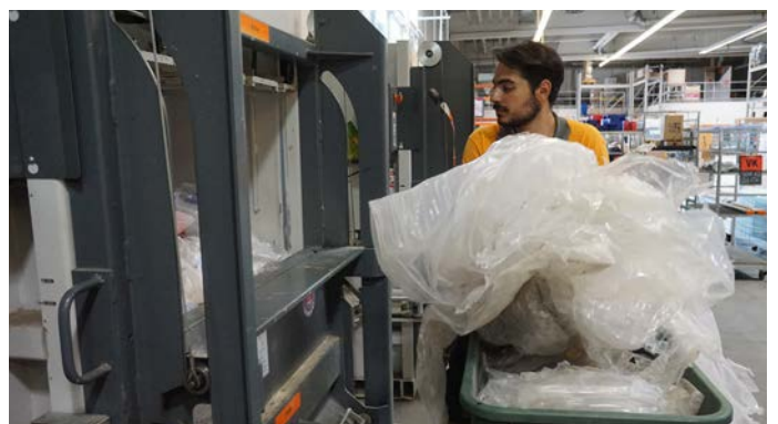
Napełnianie prasy HSM V-Press 860 folią