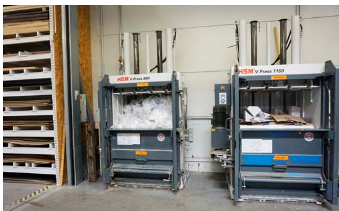
Belownice pionowe HSM V-Press 860 i 1160