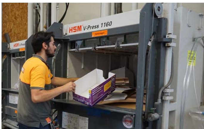
Napełnianie prasy HSM V-Press 1160 kartonem

Firma Hornbach miała dodatkowe wymagania związane z prasami HSM: ponieważ w sklepach często znajdują się mokre folie, potrzebne było lepsze zabezpieczenie przed korozją komory prasującej. Poza tym firma miała specjalne wymagania w zakresie oprogramowania. Na