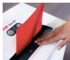
Tableau de commande clair et concis

Les agrafes et trombones ne peuvent pas endommager les cylindres de coupe en acier, durci par induction, qui garantissent une longue durée de vie à l'appareil.