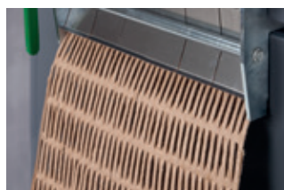
Creazione di tappetini imbottiti (HSM ProfiPack P425).