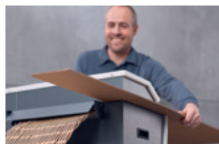
Taglio ed imbottitura in un unico passaggio