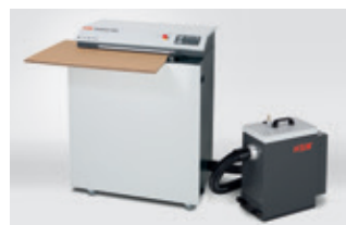
Aspiratore polveri HSM DE 1-8 per HSM ProfiPack 425 incluso set di adattamento per aspiratore