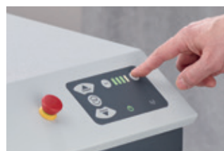
Velocità di alimentazione regolabile (modello monofase)