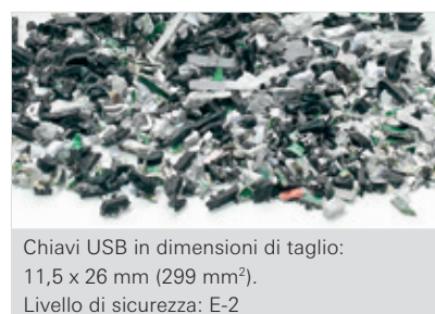
Chiavi USB in dimensioni di taglio: 11,5 x 26 mm (299 mm²). Livello di sicurezza: E-2

I dati tecnici sono indicativi. Con riserva di modifiche tecniche ed ottiche.