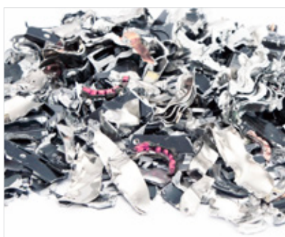
Dischi rigidi in dimensioni di taglio: 20 x 40-50 mm (<1000 m²). Livello di sicurezza: H-4