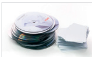
Distruzione di CD, DVD, Blu-ray, carte di credito e carte clienti