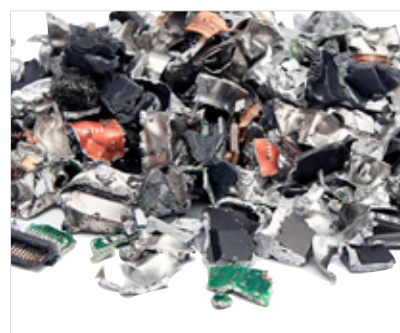
Dischi rigidi in dimensioni di taglio: 11,5x26 mm (<299 mm²). Livello di sicurezza: H-5