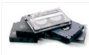
Distruzione di nastri magnetici