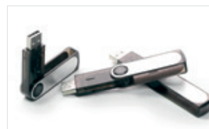
Distruzione di chiavi USB (HDS 230)