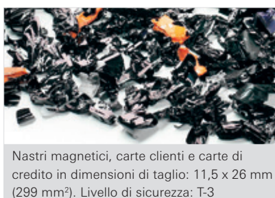
Nastri magnetici, carte clienti e carte di credito in dimensioni di taglio: 11,5 x 26 mm (299 mm²). Livello di sicurezza: T-3