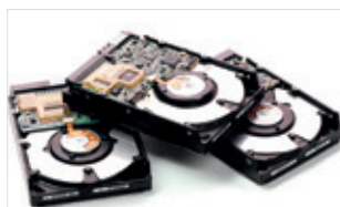
Distruzione di dischi rigidi

Sicuri, conformi sulla normative dati ed economicamente vantaggiosi.