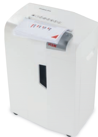
De datavernietiger HSM shredstar X13 werd ontwikkeld, om vertrouwelijke documenten eenvoudig en veilig te vernietigen.

Daarom voerde Desree Watson een akkoordverklaring in, waarin de klanten bij elk bezoek aan de kapsalon hun contactgegevens moesten vullen. Het was direct duidelijk, dat de invoering van deze formulieren de inzameling van een grote hoeveelheid aan gevoelige data met zich zou brengen. Volgens de AVG / GDPR is de eigenaresse zelf voor het voorgeschreven gebruik, opslaan en de tijdig vernietiging verantwoordelijk. Daarom startte zij een proces op, waarbij de ingevulde formulieren met de persoonsgebonden gegevens op datum gesorteerd in een afgesloten kast in het kantoor van de kapsalon veilig opgeborgen werden. Volgens de richtlijnen voor databeveiliging mochten deze informatie niet langer dan 21 dagen bewaard worden en ook niet voor marketingdoeleinden aangewend worden.