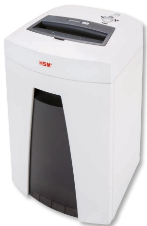
HSM SECURIO C18

Pour Nicola Kentrup la protection des données dans son cabinet est tout aussi importante que le bien-être de ses patients et patientes.