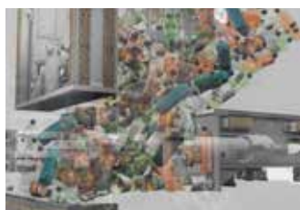
Funktionsweise 1. Stufe