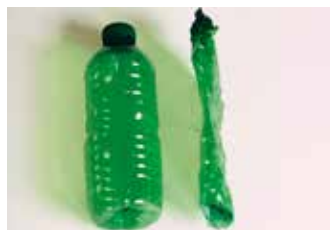
PET-Flasche original und gecrushed