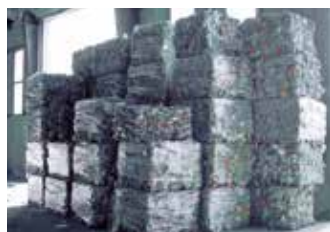
... werden zu kompakten Ballen.