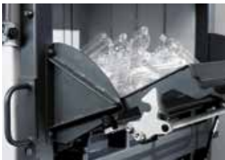
Füllklappe für PET