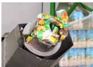
Entleeren der Gebinde bis zu 98 %