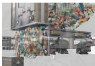
Funktionsweise 2. Stufe