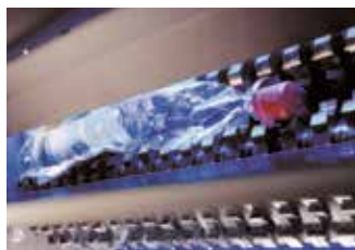
Walzen aus spezialgehärtetem Stahl

Durch das spezielle Walzensystem werden die Behälter perforiert und zusammengedrückt. So verhaken sich die Seitenwände in sich selbst und die Volumenreduktion bleibt in vollem Umfang erhalten. Zusätzlicher Vorteil des Crushens ist die zuverlässige Entwertung von PET-Pfandflaschen und -dosen.