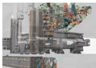
Funktionsweise 3. Stufe