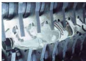
Großvolumige PET-Flaschen ...