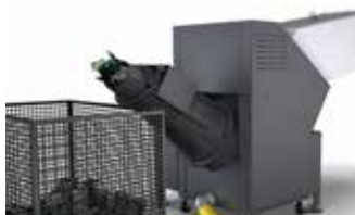
Entleeren und Verdichten in einem Arbeitsgang