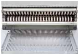
Das Drainage-System leitet Restflüssigkeit kontrolliert ab