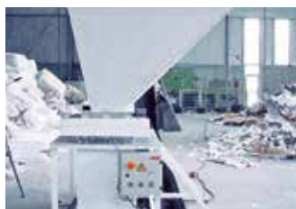
PET-Perforator für vielseitigen Einsatz ...