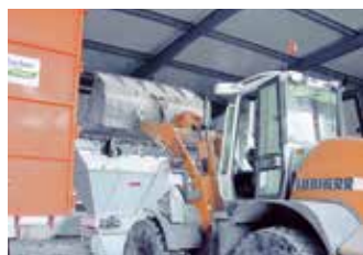
... und unterschiedliche Beschickungsarten.