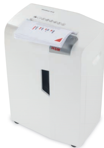
La destructora de documentos HSM shredstar X13 está diseñada para destruir documentos confidenciales de forma fácil y segura.