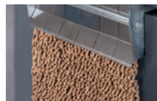
Création d'un matériau d'emballage comprimé avec un volet de compression fermé (HSM ProfiPack P425).