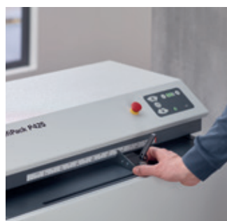
L'échelle de mesure permet d'ajuster facilement la largeur du matériau.