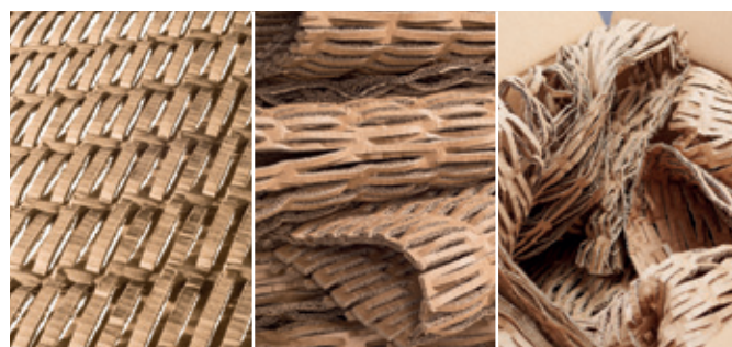
Le matériau d'emballage peut être utilisé partout où il est nécessaire et offre une protection optimale pour les objets – comme des tapis de rembourrage, des emballages rembourrés ou pour remplir des espaces vides.