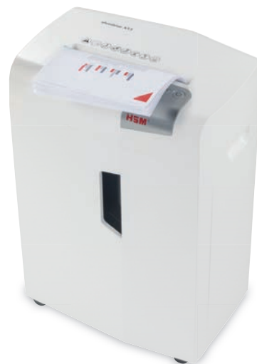
La destructora de documentos HSM shreddstar X13 está diseñada para destruir documentos confidenciales de forma fácil y segura.