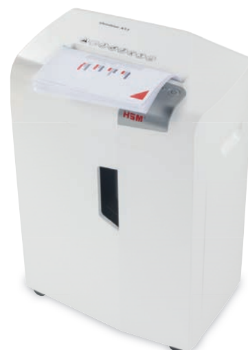
La destructora de documentos HSM shreddstar X13 está diseñada para destruir documentos confidenciales de forma fácil y segura.