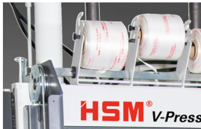
Legatura manuale delle balle con reggetta continua in poliestere