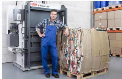
Dimensioni e pesi delle balle ottimizzati per lo stoccaggio, il trasporto e la commercializzazione economica diretta