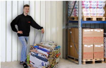
Estrazione e prelievo della balla con carrellino di trasporto in dotazione