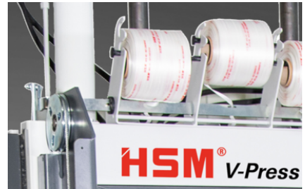
Legatura manuale delle balle con reggetta continua in poliestere