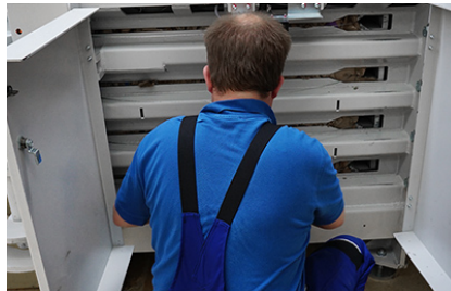
Legatura manuale delle balle con filo