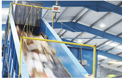
Per un carico continuo con nastro trasportatore