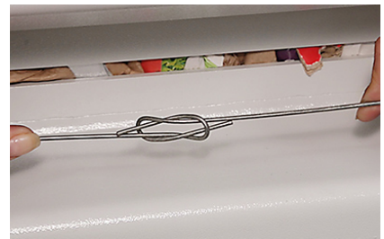
Legatura manuale delle balle con filo metallico Quick-Link