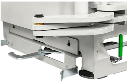
Bloccaggio dei pallet per una sicura estrazione delle balle