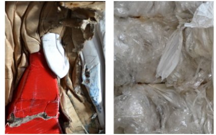
Particolarmente adatta per la compattazione di cartoni e pellicole