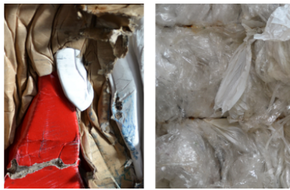
Particolarmente adatta per la compattazione di cartoni e pellicole