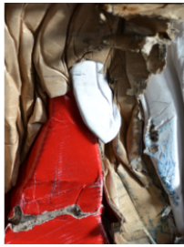
Particolarmente adatta per la compattazione di cartoni e pellicole