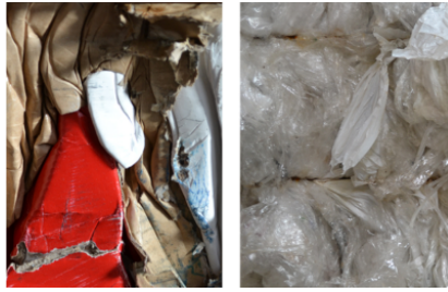
Particolarmente adatta per la compattazione di cartoni e pellicole