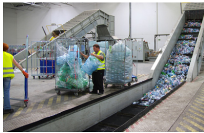
Per un carico continuo con nastro trasportatore o con impianti d'aspirazione