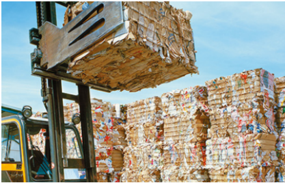
Particolarmente adatta per la compattazione di carta, cartoni e pellicole