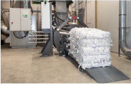
Integrazione in processi produttivi industriali automatizzati