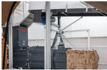
Integrazione in processi produttivi industriali automatizzati