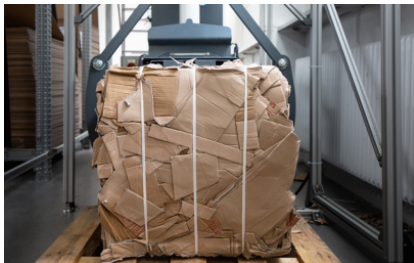
In opzione è disponibile anche nella versione con legatura manuale