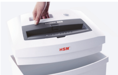
Per svuotare il contenitore di