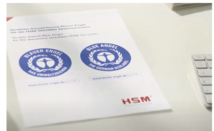
Il distruggidocumenti ha ottenuto