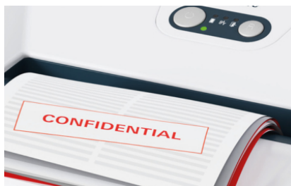
L'insertion du papier avec