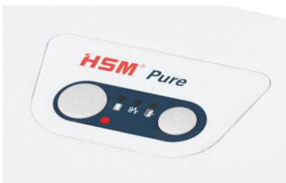
La machine s'éteindra